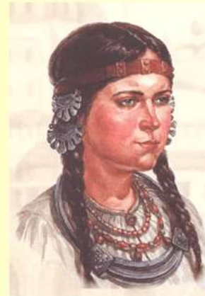
Девушка из рода вятичей, X в.

Расположение в месте пересечения водных и сухопутных путей было очень выгодным и способствовало процветанию города. Правда сухопутное